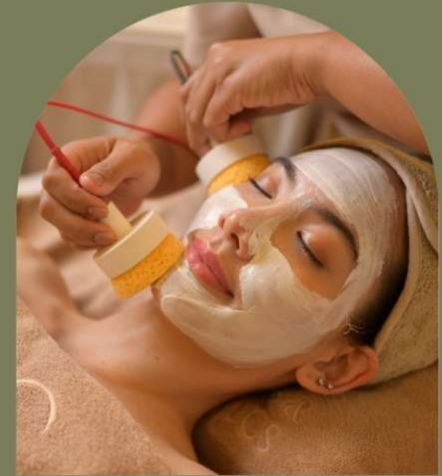
重塑面部 REMODELING FACE